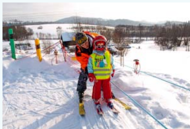
Lyžařská škola v Kunčicích