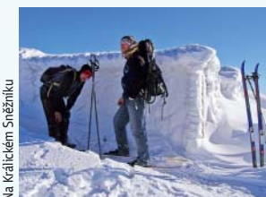
Na Králickém Sněžníku

Máte na výběr ze dvou variant: pokud si chcete ulehčit trasu, využijte skibus, kterým se dopravíte ze Starého Města do Hynčic pod Sušinou a zde, u horní stanice vleku Sušina, nastoupíte na vrstevnici, která vás doveze až na chatu Návříš. Odtud pokračujte po silnici směrem k opravené lesní kapličce, pak dolů do Stříbrnic a přes Hadcovou do Starého Města (od kapličky až do SM modrá turistická značka). Délka trasy činí asi 12 km.