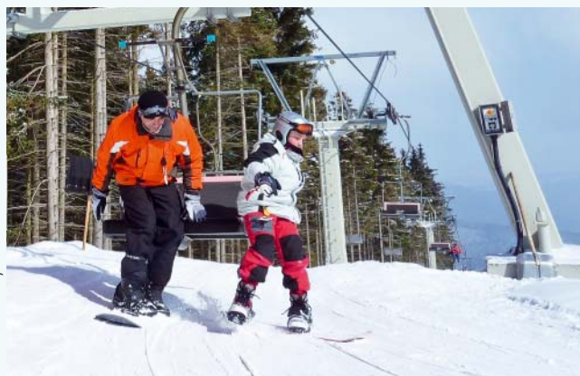
Snowboardisté na sjezdovce ve Stříbrnici

Zima do Starého Města přichází velmi brzy a sníh na kopcích drží téměř polovinu roku. Užijte si zimní sezónu naplno a vyzkoušejte všechny zdejší skiareály – Kunčice, Hynčice-Stříbrnice, a Velké Vrbno . Je tu pro Vás připraveno 16 lyžařských vleků s lehčími a obtížnějšími sjezdovkami. Tratě jsou upraveny rolbami a dle potřeby i umělým zasnežováním. Téměř všechna střediska nabízí večerní lyžování, půjčovnu lyží a snowboardů, skiservis a lyžařské školy. Užijí si zde jak oslehaní sjezdaři, tak malé děti, které stojí na lyžích prvním rokem.