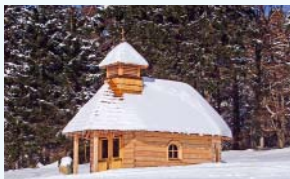
Kaplička na Paprsku