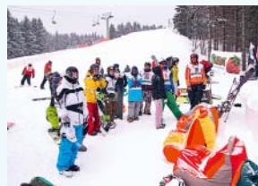
Zimní radováňky na Paprsku