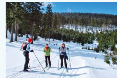
Cesta na Návříš

Na trasu nastoupíte ve Starém Městě v tzv. lípy v ulici Nové. Provede vás kolem pevnostních bunkrů StM 33 a StM 34 a obě se potkávají pod Kutným vrchem. Tady se můžete napojit na stopu, která vede směrem ke kapličce u Šléglova a k lyžařskému vleku v Branné. Nebo od Kutného vrchu zamíříte opačným směrem, na Kronfelzov, Ostružník, Paprsek.