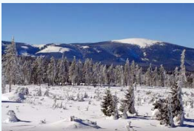
Masív Králického Sněžníku

Chcete vyzkoušet každý den jinou sjezdovku a nechce se Vám vyjíždět autem? Rozumíme tomu a proto pro Vás zimní střediska nachystala SKIBUS ZDARMA . Jedním skibusem se dostanete pravidelně ze Starého Města do Velkého Vrbna k lyžařským střediskům Paprsek a Olšanka. Druhý skibus Vás ze Starého Města doveze do Hynčice pod Sušinou nebo k sedačkové lanovce do Stříbrnic.